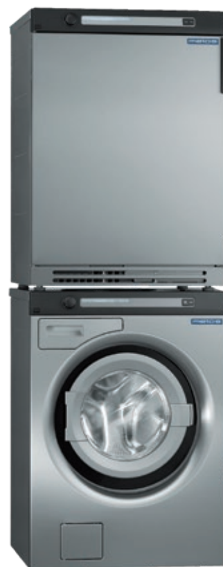
SC65 og DAM6 montert i søyle.